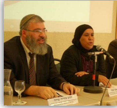
מתארחים בכנס גישורים 2012: "מרכזי הגישור והדיאלוג בקהילה על סדר היום החברתי"

בהקשר האזרחי הפורום אוסף לחיקו משתתפים מקבוצות תרבותיות בעיר, שהן קבוצות אתניות שאותרו בתהליך הלמידה על הקהילה. בפועל, המשתתפים הם מנהיגים מקבוצות זהות בעיר שלא פעם מצטלבות זו עם זו. לזהויות אלה מאפיינים ואינטרסים שונים, כך למשל קבוצות דתיות (נוצרים, יהודים, מוסלמים), זהויות לפי תפקידים ומקצועות שונים בעיר (חינוך, רווחה, משטרה, גישור), זהויות פוליטיות המחזיקות בתפיסות שונות לגבי ניהול העיר (תפקידי מפתח בעיריה, בארגונים עירוניים ומנהיגי קהילות תרבותיות) וקבוצות זהות אחרות בעיר שיש להן מאפיינים קהילתיים נוספים (מוצא, גיל, מגדר).