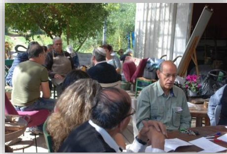
מפגש גיבוש וכתובת חזון הפורום 2011

עבודה ביקורתית במרחב הפוליטי: את הפורום מאיישים מנהיגים של קבוצות זהות ומנהלים מקצועיים ועל כן אל תוך הפורום נכנסים אינטרסים ומהלכים שונים. לא ניתן לצפות מהפורום כי יתנהל כבתוך וואקום ניטראלי, שהרי מראש מובנים בו יחסי מרות