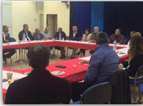
פורום המנהיגים מתארח אצל החברה המוסלמית במתנ"ס קלור, מתנ"ס ערבי-רמלה 2015